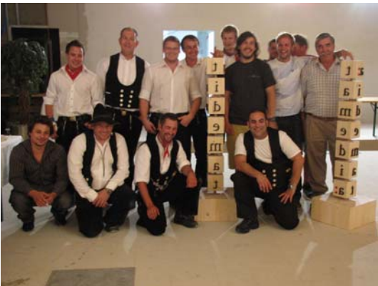
Am 24. August 2012 wird die Aufrichte gefeiert.