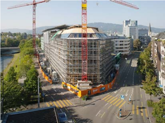
Die Fassade wird im Oktober 2012 geschlossen.