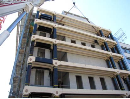
Ab April 2012 wird die Holzkonstruktion zusammengebaut.